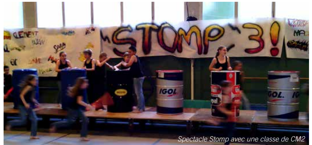
Spectacle Stomp avec une classe de CM2

La concertation est primordiale jusqu'au terme du projet. « En tant qu'intervenante, je fais de nombreuses recherches et élabore plusieurs scénarios correspondant au public que j'aurai en face de moi. Les enseignants, quant à eux, valident ou non mes propositions ou les font évoluer. Lors du face-à-face avec les élèves, je mène les séances en présence de l'enseignant qui observe et participe selon son aisance. Il est d'une aide précieuse dans la connaissance des enfants, du groupe et dans le suivi des apprentissages durant la semaine. »