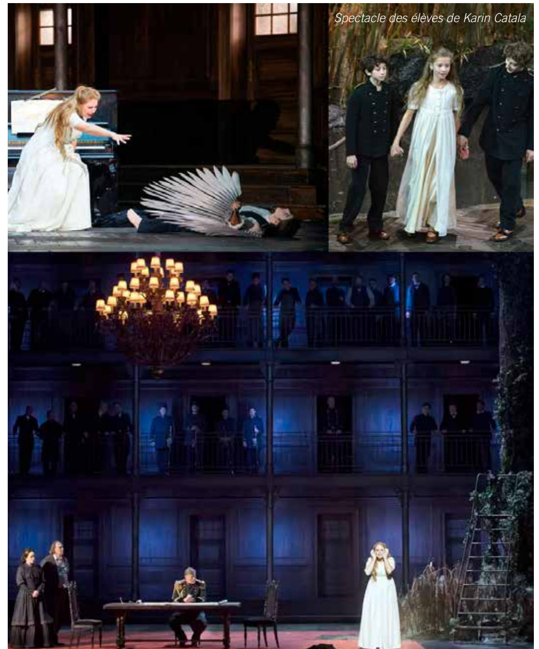
Spectacle des élèves de Karin Catala

En cours, une large place est réservée à l'improvisation, puis à la création. Chaque saison, le travail créatif s'appuie sur les propositions des élèves et sur un travail